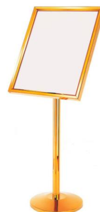
Примерный вариант: Стенд экспозиционный