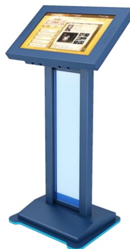
Примерный вариант: Интерактивный сенсорный стол/киоск