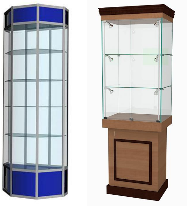
Примерный вариант: Витрина экспозиционная

Рис. 1. Модуль С «Разработка экскурсионных программ обслуживания / экскурсий», Модуль D «Проведение экскурсий»